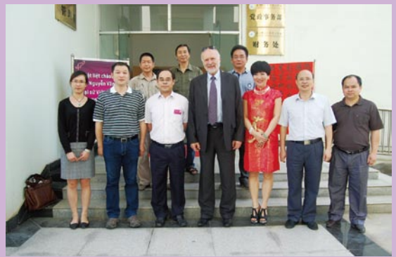
2013年5月23日，克罗地亚驻华大使（中）莅临我院检查指导工作