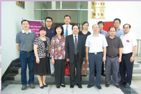
2013年5月23日，越南驻华大使（中）莅临我院检查指导工作